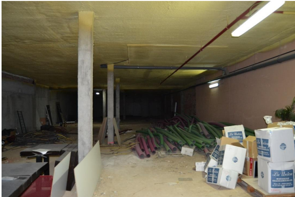
IMAGEN 1: ESTADO ACTUAL DE LA SALA A REFORMAR (A LA DERECHA SE SITUARÍA LA ENTRADA PRINCIPAL ACRISTALADA)