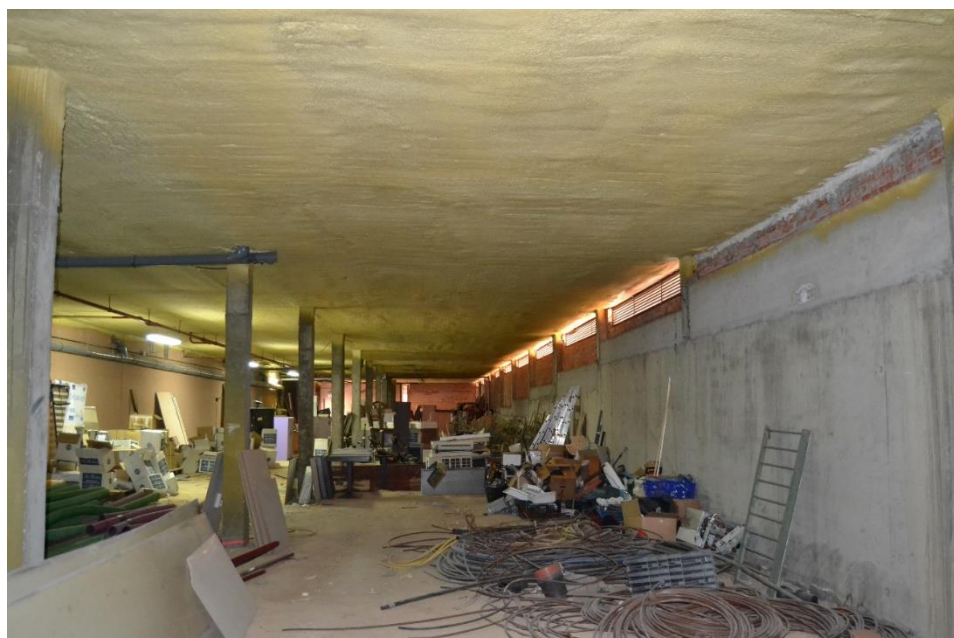
IMAGEN 2: ESTADO ACTUAL DE LA SALA A REFORMAR (A LA IZQUIERDA SE SITUARÍA LA ENTRADA PRINCIPAL ACRISTALADA)