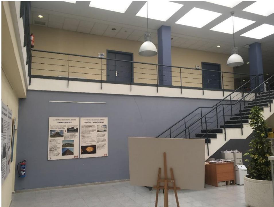
IMAGEN 3: ESTADO ACTUAL DEL HALL DE ENTRADA DE LA SALA A REFORMAR (ENTRE LA ESCALERA Y EL EXTINTOR SE SITUARÍA LA ENTRADA PRINCIPAL ACRISTALADA)